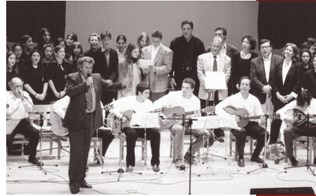
Συναυλία-αφιέρωμα στον Μίκη Θεοδωράκη (1996)