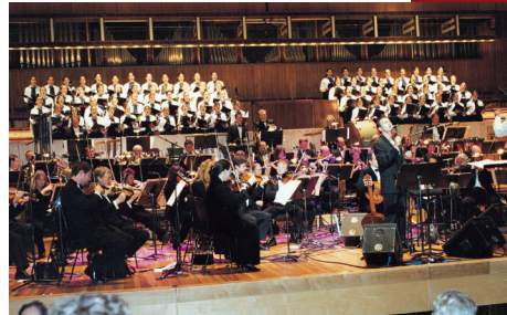
Η Χορωδία στο Royal Festival Hall του Λονδίνου (2000)