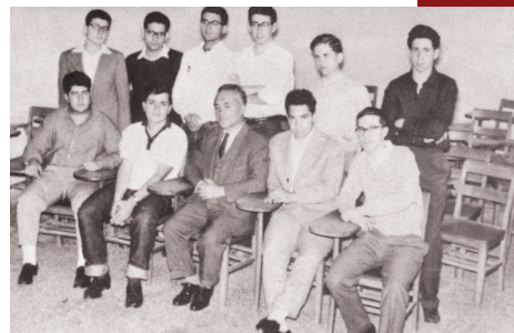
Όμιλος Κλασικής Μουσικής (1960)