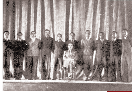
Χορωδία του Κολλεγίου (1938)

Με την καλλιτεχνική δραστηριότητα αποφοίτων του (μουσική, θέατρο, κινηματογράφος, εικαστικά κ.λ.), ξεκινώντας από τους παλαιότερους (π.χ. Νικηφόρος Ρώτας, Ζακ Ιακωβίδης στη μουσική, Αλέξης Σολομός, Δημήτρης Χορν στο θέατρο) μέχρι τους μεταγενέστερους (όπως, π.χ., ο διεθνώς καταξιωμένος συνθέτης Στρατής Μηνακάκης, ο φλαουτίστας Τάσος Δημητριάδης, Διευθυντής μεγάλων μουσικών φεστιβάλ σε Ευρωπαϊκές χώρες, ο μαέστρος Νίκος Μιχαλάκης, ο βιολονίστας Δημήτρης Σέμψης, εξάρχων της Κρατικής Ορχήστρας Αθηνών (στη μουσική), ο Αλέξανδρος Αντωνόπουλος, ο Κώστας Αρζόγλου, ο Δημήτρης Μαλαβέτας, ο Αλέξανδρος Μυλωνάς, ο Δημήτρης Παπαϊωάννου, ο Γιάννης Χουβαρδάς (στο θέατρο), ο Μανούσος Μανουσάκης (στον κινηματογράφο-τηλεόραση) και αμέτρητοι νεότεροι-σύγχρονοι με διακρίσεις σε κάθε μορφή τέχνης.