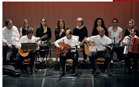
Μουσική Συντροφιά 96 (2015)