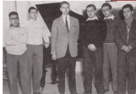
Όμιλος Όπερας (1956)